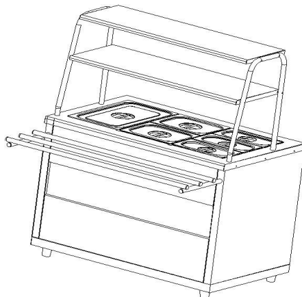
Рис.1 Общий вид мармита МЭП-2Б-П/ЛП, МЭП-2Б-П/ЛПЭ

Общий вид мармита представлен на рис. 1. В серии «Ли́ра-Профи» корпус мармита изготовлен из нержавеющей стали, в серии «Ли́ра-Профи Э́ко» отдельные элементы изготовлены из окрашенной оцинкованной стали. В столешницу мармита встроена прямоугольная паровая ванна с электронагревательными элементами.