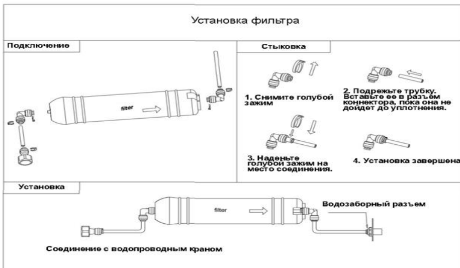
Рис.2 Схема подключению к водоснабжению.