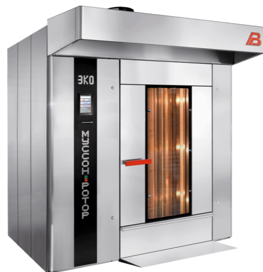
“Муссон ротор” модель 99/11-02