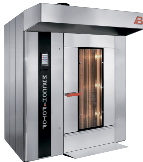
“Муссон ротор” модель 77М-01, 77М-02

- верхний привод вращения стеллажной тележки, передающий вращающий момент через рамку платформы, низкий порог пекарной камеры, короткий пандус, верхний узел фиксации тележки, запатентованный на территории РФ, упрощает закатывание тележки, позволяют избежать встряски тестовых заготовок при закатывании стеллажной тележки, исключают ее смещение во время выпечки