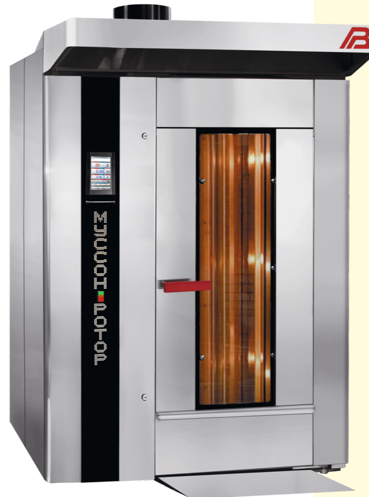
«Муссон-ротор» модель 55-01, 55-02, 55P-01, 55P-02

Multi-purpose rotary ovens (gas, liquid fuel, electric heating)