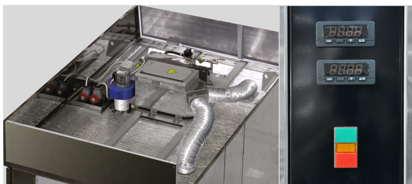
Климатор, размещенный на крыше шкафов. (модели «Бриз-122», «Бриз-222», «Бриз-342», «Бриз-344П»)