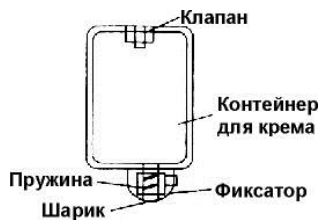
Рис.2. Контейнер для крема