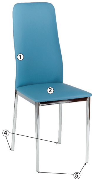
СХЕМА СБОРКИ СТУЛА «ВЕСТ»