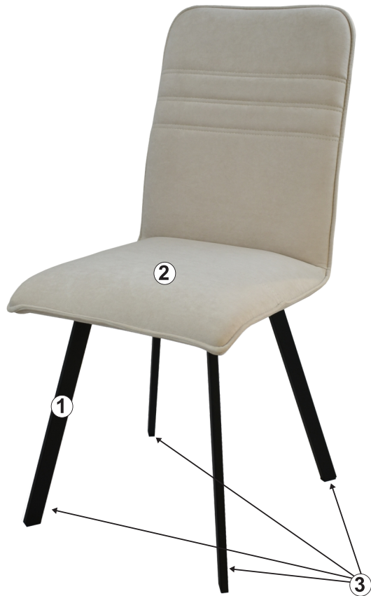
СХЕМА СБОРКИ СТУЛА «СОФИЯ ГРАНДЕ»