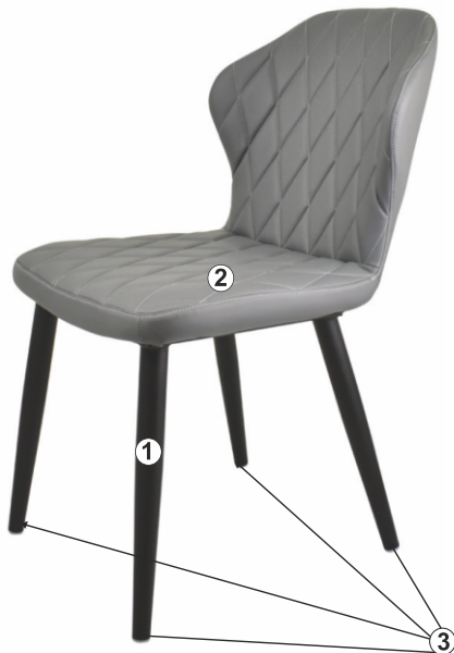
СХЕМА СБОРКИ СТУЛА «БЕРГАМО», Барный, П/Барный», «БЕРГАМО-ЭЙР», «БЕРГАМО-ЭЙР Барный, П/Барный», «БЕРГАМО-SKY», «БЕРГАМО-SKY Барный, П/Барный»,