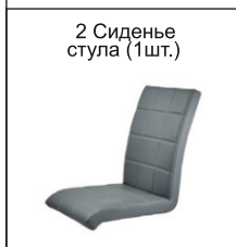
СХЕМА СБОРКИ СТУЛА «Эмполи», «Эмполи ЛОФТ», «Эмполи ЛЮКС», «Эмполи РЕЛАКС», «Эмполи БАРНЫЙ», «Эмполи П/БАРНЫЙ»