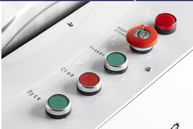
Рис.2 Панель управления