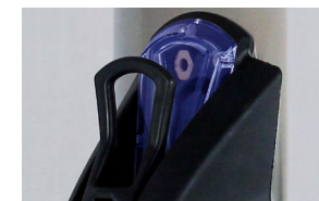
Индикатор с подсветкой