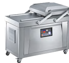
INDOKOR IVP-500/2S двухкамерный